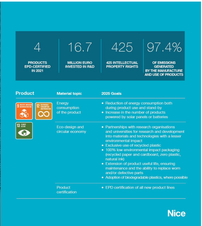
Figura 5. Infografica relativa alla dimensione di prodotto Nice.