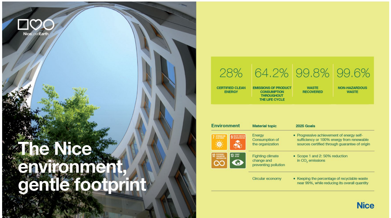
Figura 3. Infografica relativa alla dimensione ambientale di Nice.