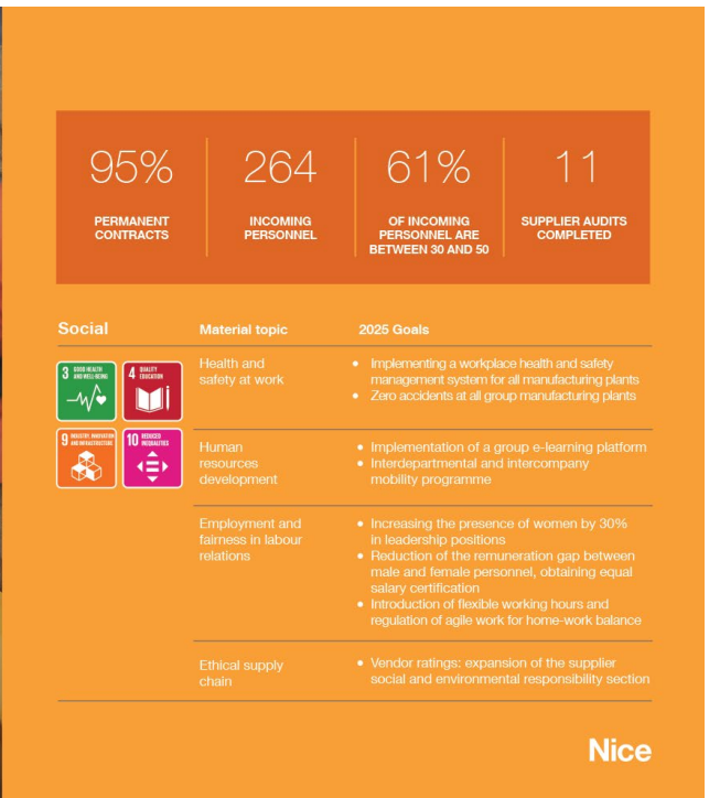
Figura 4. Infografica relativa alla dimensione sociale di Nice.