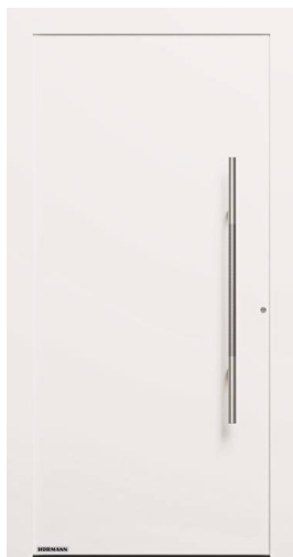
Modello ThermoCarbon Motivo 860

Linee pulite e design essenziale per questa versione della porta d'ingresso ThermoCarbon. Ad accentuare il sapore minimal di questa chiusura sono inoltre il colore bianco RAL 9016 e la sottile maniglia in acciaio inox.