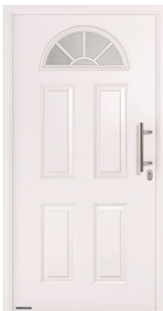
Modello Thermo46 Motivo 200

Grazie al bianco traffico satinato (RAL 9016) e al vetro cattedrale a battitura fine con traverse appoggiate nella parte alta, la porta d'ingresso Thermo46 presenta in questa versione un sapore un po' country chic.