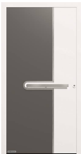
Modello ThermoSafe Motivo 585

Per gli amanti del colore, la porta d'ingresso ThermoSafe si veste qui di uno stile White & Grey che ben si sposa con l'essenziale maniglia in acciaio inox e le luminose decorazioni in alluminio.