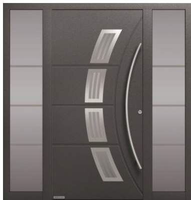
Modello ThermoSafe Motivo 188

Dallo stile contemporaneo ed esclusivo, questa porta in Titan Metallic dispone di elementi laterali e finestre che consentono un'elevata luminosità nell'ingresso dell'abitazione. Questa chiusura ha un valore di trasmittanza termica fino a 0,87 \text{ W}/(\text{m}^2 \times \text{K})