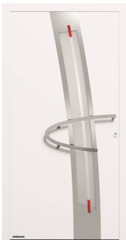
Modello ThermoSafe Motivo 552

Grazie al dinamismo della maniglia e delle decorazioni in acciaio inox, nonché al vetro decorativo Float opaco con strisce trasparenti e pellicola rossa, la porta d'ingresso ThermoSafe assume qui un tono contemporaneo e un po' avveniristico.